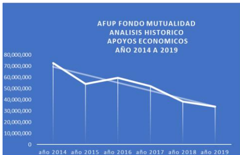
PANORAMA FINANCIERO FONDO DE MUTUALIDAD EN RETROSPECTIVA 2014 A 2020