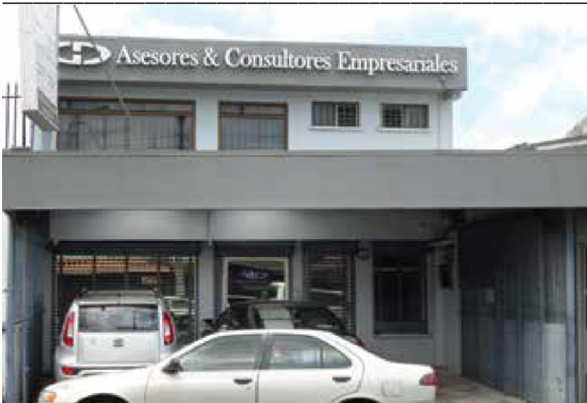
Tercer casa sede, Betania de Montes de Oca, sin fecha.