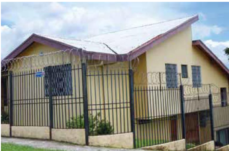
Primera casa sede 1995, residencial Los Profesores.

La Sala IV, el 11-10-1991, votó en forma favorable el recurso de amparo, el cual constituyó la mayor conquista de AFUP, para todos los jubilados que adquirieran el derecho con la Ley 2248, además se hizo extensivo a otros regímenes de pensionados.