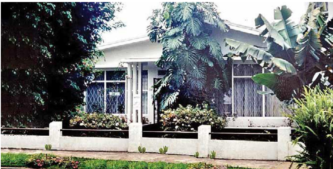
Cuarta y actual sede de AFUP, urbanización Los Profesores.