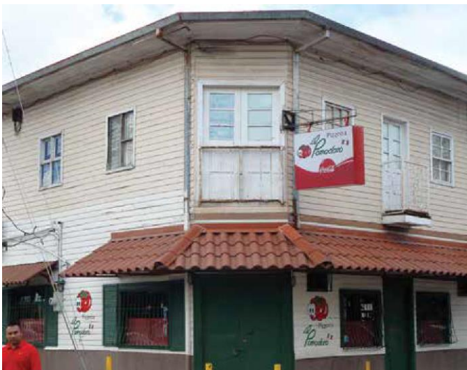
Segunda casa sede, altos Restaurante Pomodoro, San Pedro Montes de Oca, sin fecha.