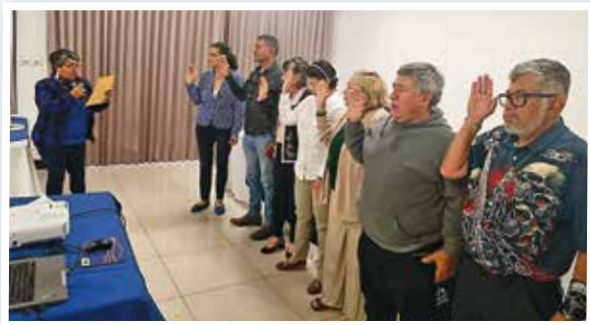
Juramentación de los nuevos integrantes de Junta Directiva de Filial de Cartago 2026.