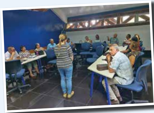
Charla impartida por JUPEMA a nuestra Filial

A ctividad de fin de año de AFUP central. Un grupo de la Filial participó en esta actividad realizada en Hacienda Doka, en Heredia. Se conoció sobre el proceso del café, desde el sembrado hasta el producto final empacado. Se compartió con las demás filiales.