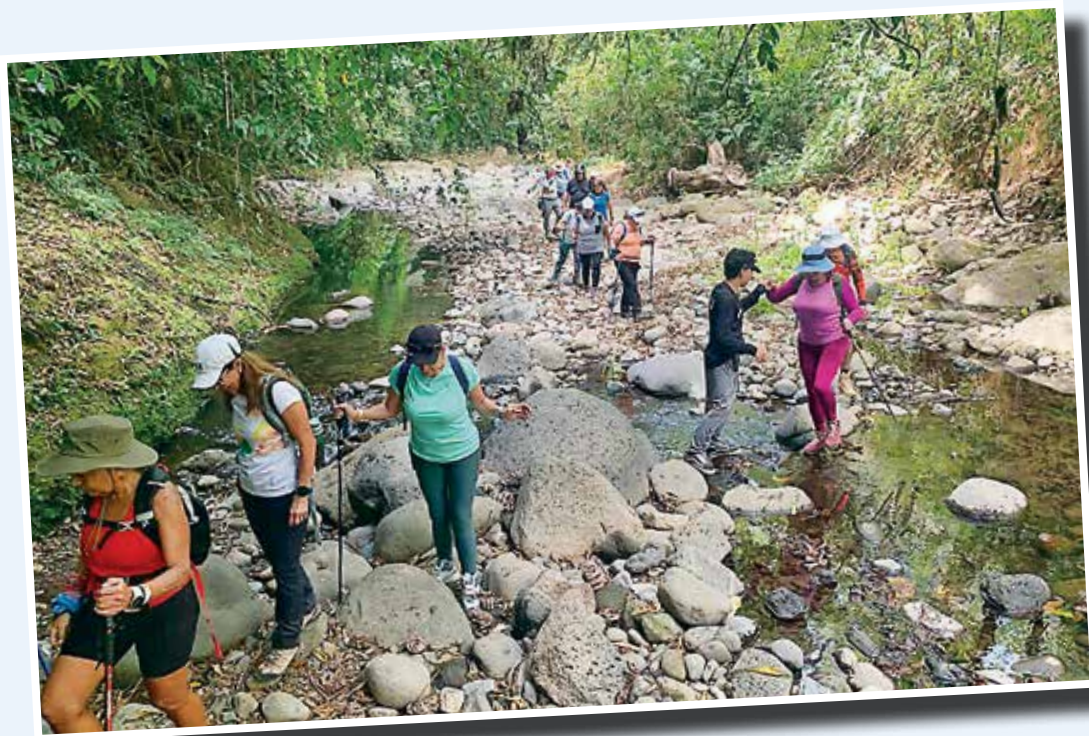
Club de Senderismo de AFUP.