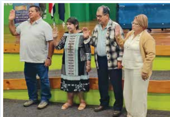
Juramentación oficial de la nueva Junta Directiva.