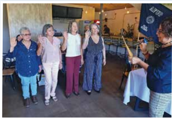
Juramentación de los nuevos integrantes de la Junta Directiva de Filial de Occidente 2026